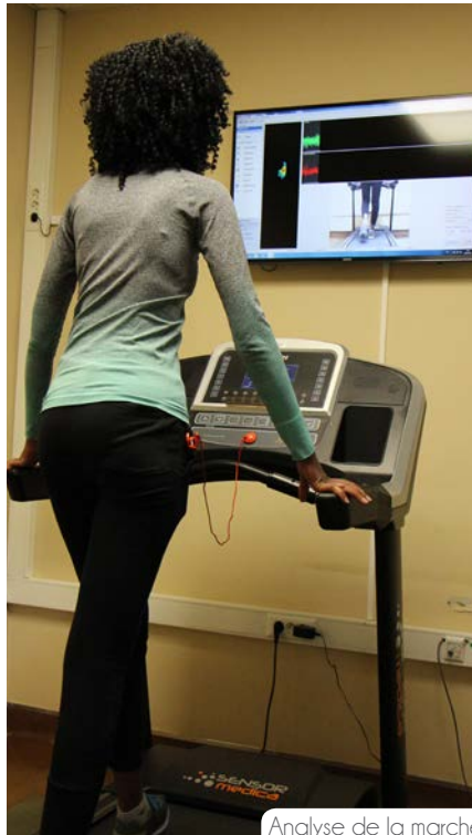
Analyse de la marche