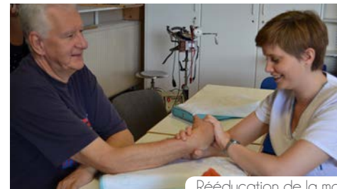
Rééducation de la main