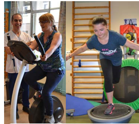
Rééducation du dos et reconditionnement à l'effort