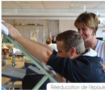
Rééducation de l'épaule

La LHF est un partenaire fort du GHdC et en particulier de son centre de réadaptation. Pour la LHF, le centre de réadaptation du GHdC peut accueillir ses handisportifs et pour certains patients, cela peut être la voie d'accès vers le handisport.