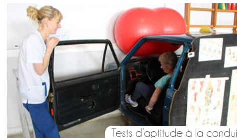
Tests d'aptitude à la conduite