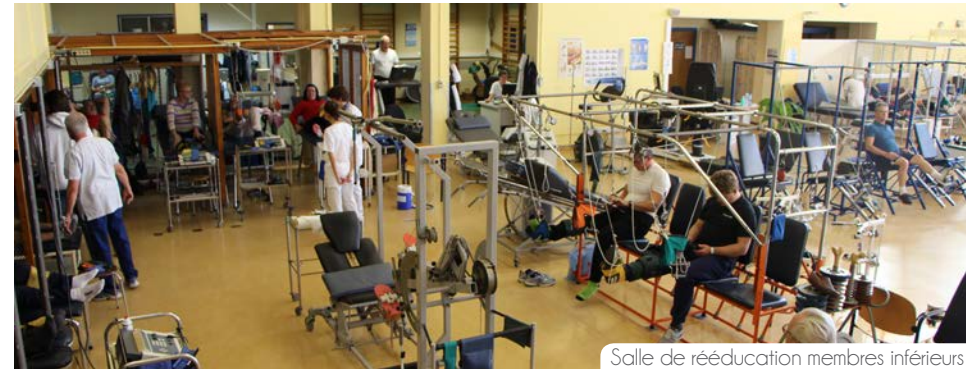
Salle de rééducation membres inférieurs