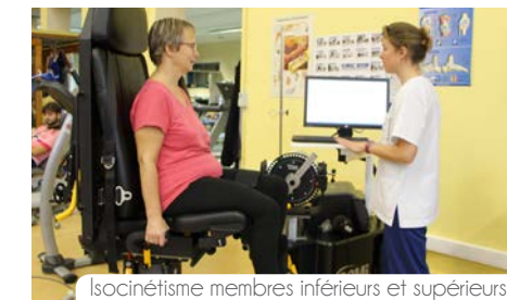
Isocinétisme membres inférieurs et supérieurs