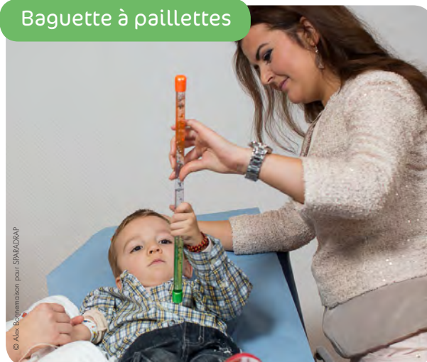
Baguette à paillettes