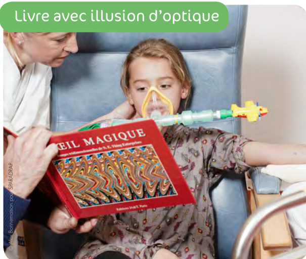
Livre avec illusion d'optique