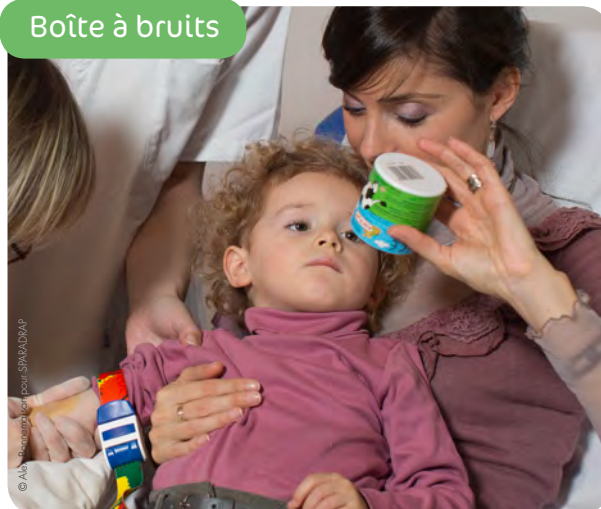
Boîte à bruits