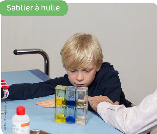
Sablier à huile